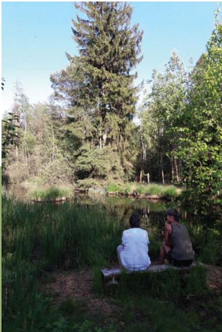
Fig. 2: Impression du Hudelmoos 2018.

et pratiques personnelles ainsi qu'aux réalités locales: ces histoires doivent être prises en considération et transmises. Ainsi, les nouvelles générations ou les nouveaux arrivants peuvent – à nouveau – s'identifier aux paysages et se sentir «chez eux».